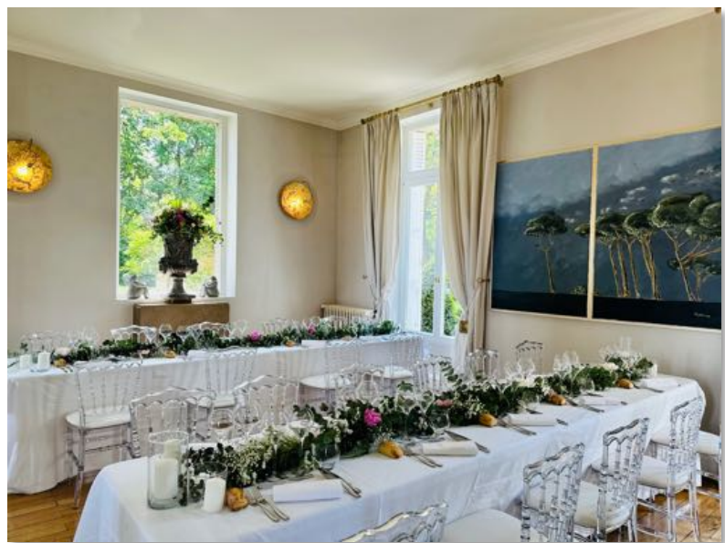
Domaine de Pr cy, 1 Place de l' glise, 60460 Pr cy Sur Oise 06.88.22.13.12 / events@chateauprecy.com